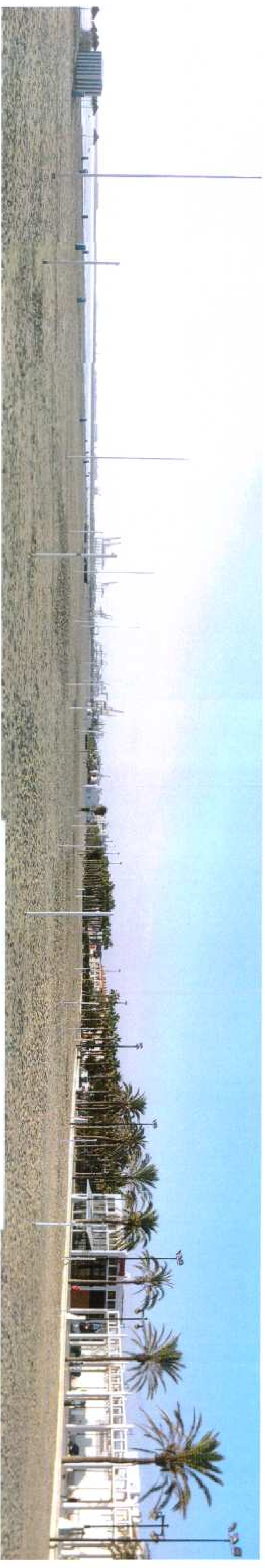
Visual hacia la actuación