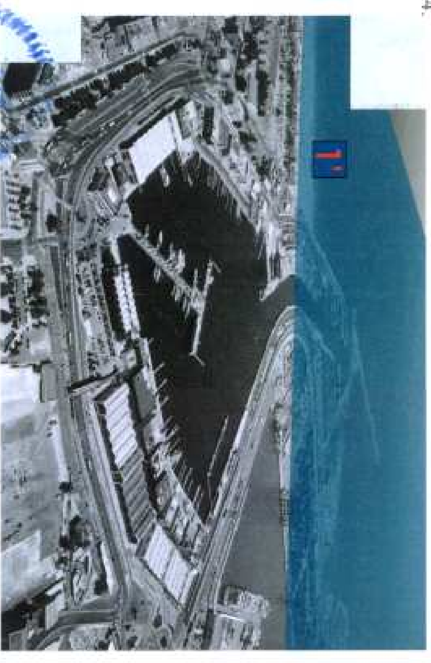
Punto de Observación desde la Playa

APROBADO DEFINITIVAMENTE POR LA HBLE. CONSELLERA DE INFRAESTRUCTURAS, TERRITORIO Y MEDIO AMBIENTE, CON CARÁCTER PARCIAL EN EL ÁREA CONCRETA DEL ÁMBITO PATRIMONIAL (ÁMBITO I), Y SUSPENDIDO EN EL ÁMBITO DE LA ZONA QUE AFECTA AL PTR-3 SISTEMA GENERAL PORTUARIO (ÁMBITO II) EN FECHA 6 DE MAYO DE 2014.