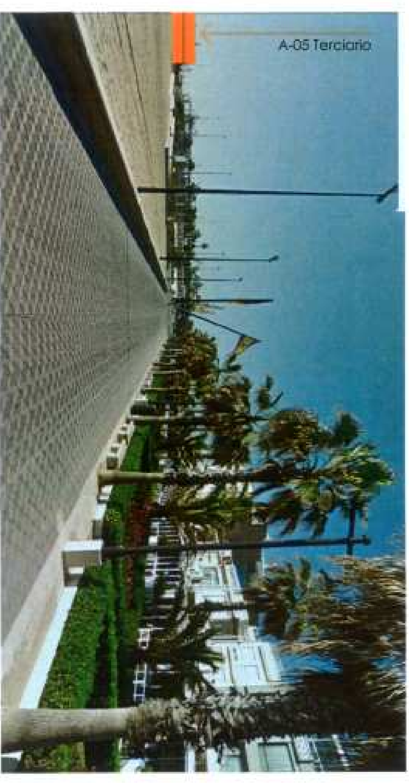
Ordenación pormenorizada/ Punto de vista 1'