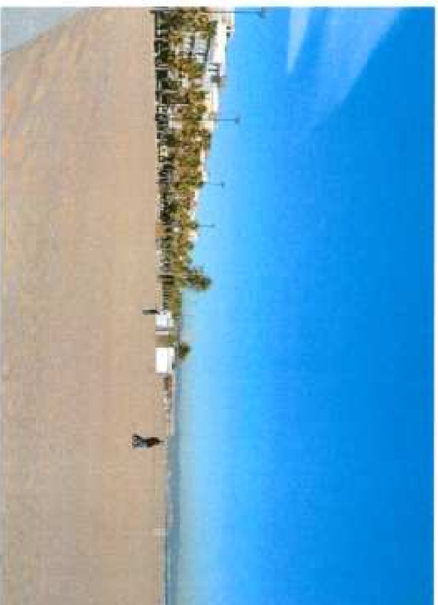
Visual desde la actuación