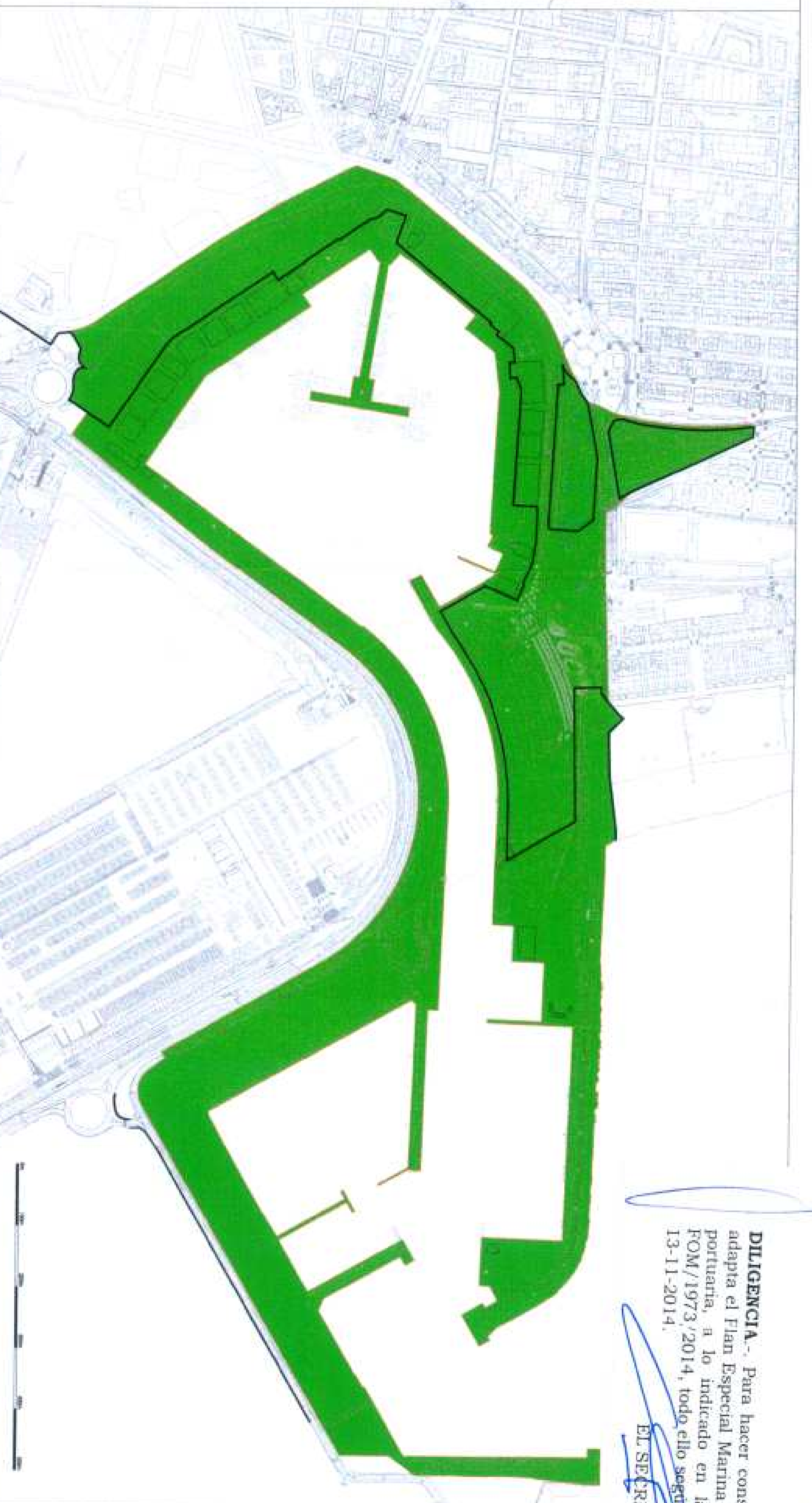
ÁMBITO DE ACTUACIÓN 586.700 m 2

DILIGENCIA. Para hacer constar que el presente documento adapta el Plan Especial Marina Real Juan Carlos I, en la zona portuaria, a lo indicado en la Delimitación por Orden FOM/1973/2014, todo ello según Resolución Alcaldía U-719 de 13-11-2014. EL SECREARIO,