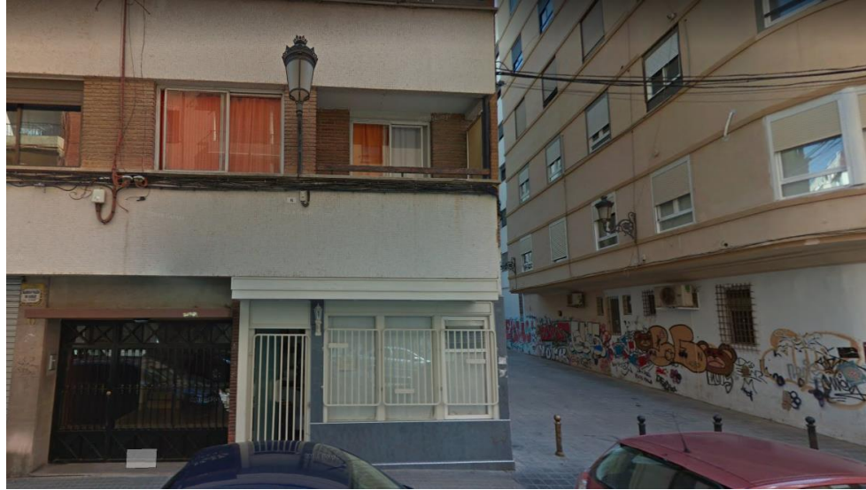
Vista del callejón y la medianera Este desde la calle Navarra