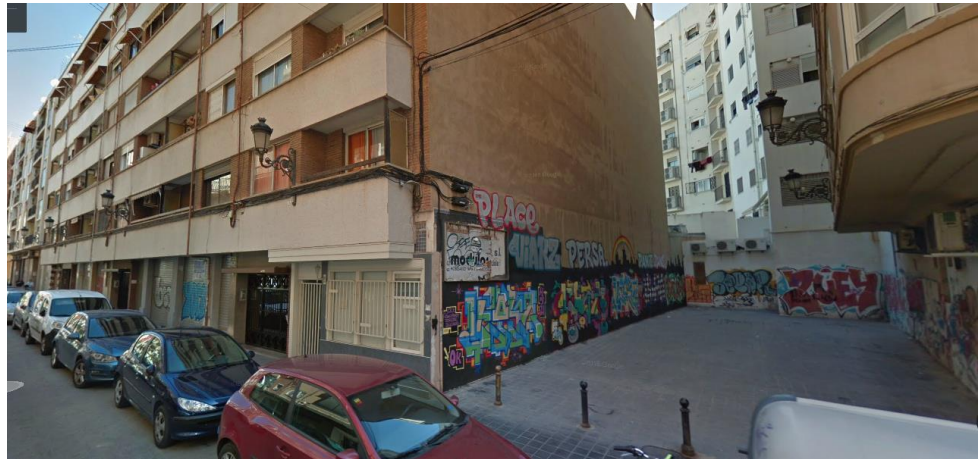
Vista del callejón y la medianera Oeste desde la calle Navarra

DOCUMENTO INICIAL ESTRATÉGICO DE LA MP DEL P.G.O.U en Callejón Malabuche