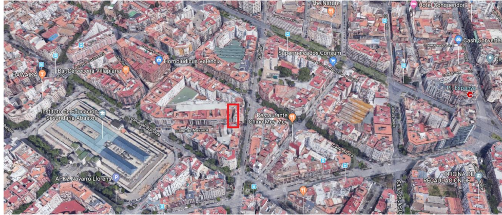
Vista aérea del ámbito de actuación

La situación actual del territorio y del medio ambiente antes de la aplicación del plan en el ámbito afectado, se refleja en las siguientes imágenes desde la calle Navarra y vista aérea: