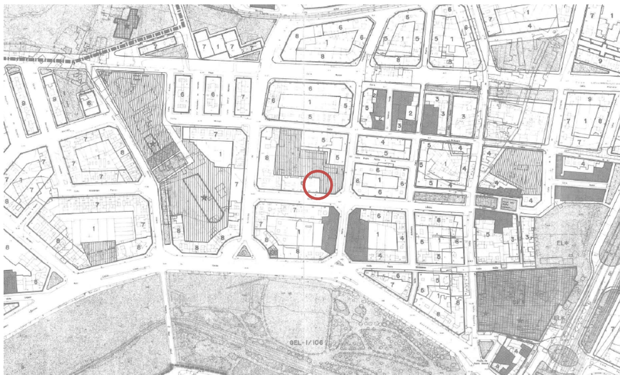
Plano nº 28 “serie C” PGOU de València

La subsanación del error gráfico en los planos del PGOU, no afecta ni a la “serie A”, ni a la “serie B”, ya que no se modifica la clasificación, ni la calificación de la parcela; por lo que sólo se corregirá el error en la “serie C”, concretamente en plano número 28, al variar los límites de la trama de Sistema Local Educativo-Cultural Escolar (EC) que ocupa parte de una parcela edificable privada situada en la Calle Lérica nº 20.