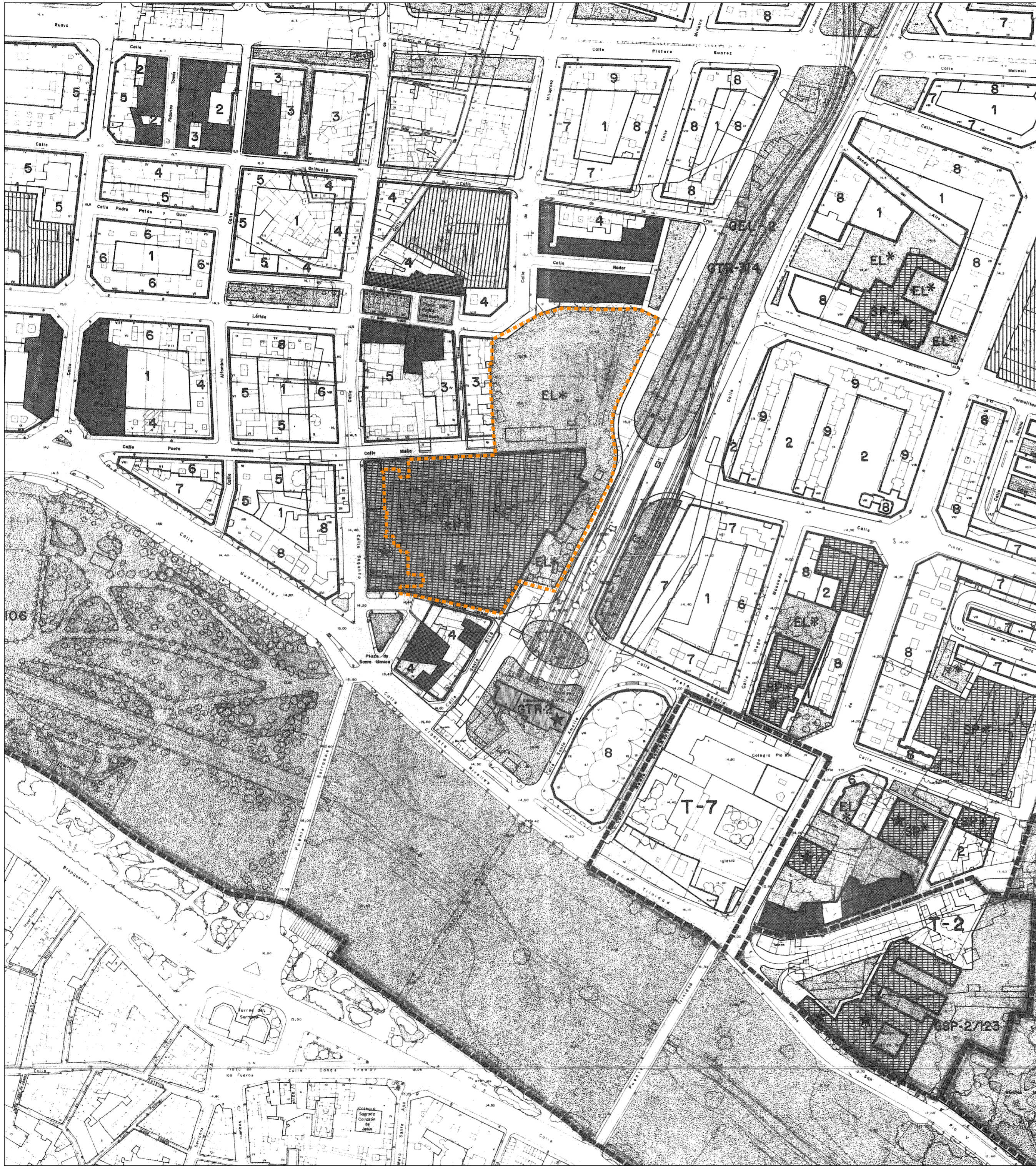
BASE : PGOU VALENCIA 14-01-1989. ESTRUCTURA URBANA. PARAMETROS DE LA EDIFICACION. SISTEMAS GENERALES Y LOCALES. AMBITOS DE PLANEAMIENTO. SERIE C. HOJA 28 · ESCALA 1/2000