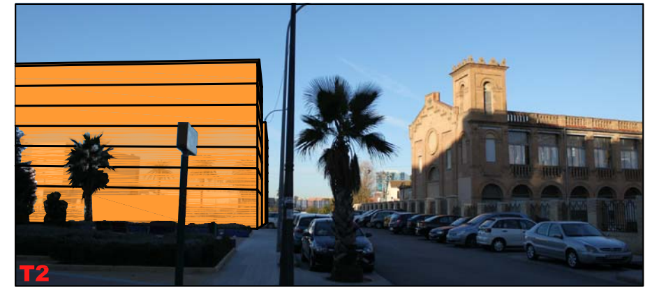
OBSERVACIÓN ESTÁTICA DESDE CALLE RÍO TAJO