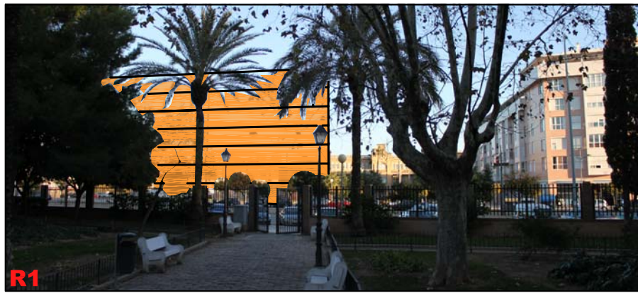
OBSERVACIÓN ESTÁTICA DESDE PARQUE DE LA REMONTA