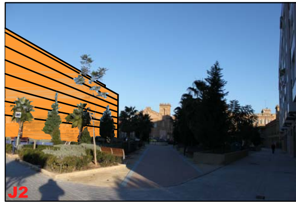
OBSERVACIÓN ESTÁTICA DESDE JARDÍN DE CALLE RÍO PISUERGA