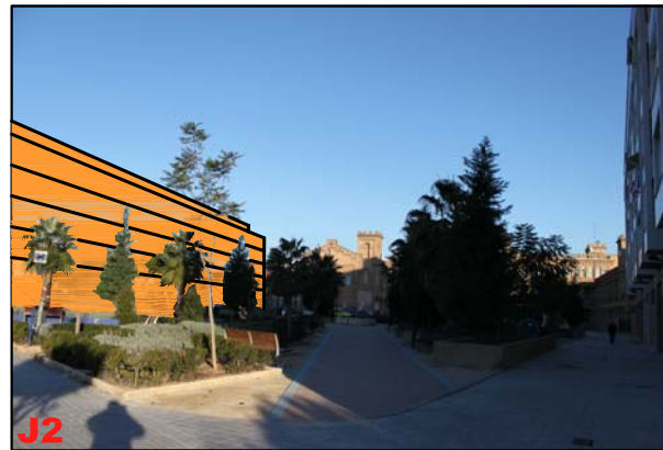
OBSERVACIÓN ESTÁTICA DESDE JARDÍN DE CALLE RÍO PISUERGA