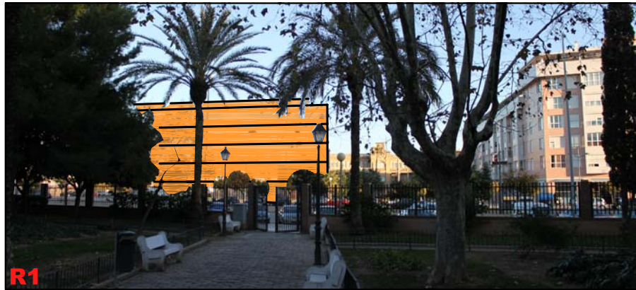
OBSERVACIÓN ESTÁTICA DESDE PARQUE DE LA REMONTA