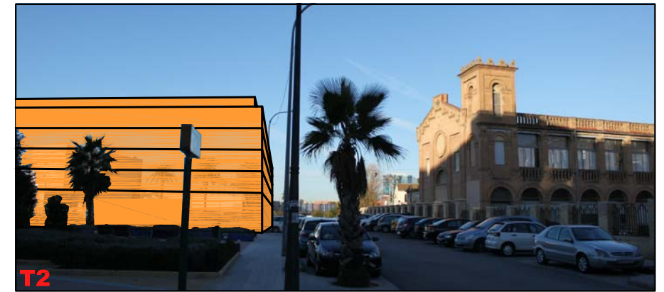
OBSERVACIÓN ESTÁTICA DESDE CALLE RÍO TAJO