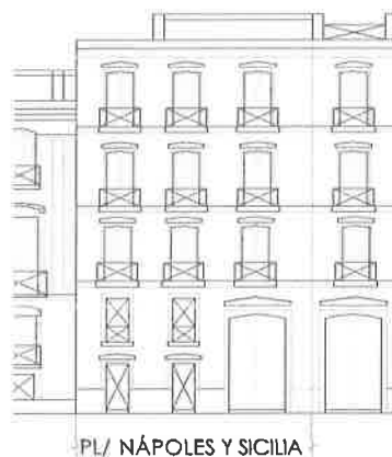
PL/ NÁPOLES Y SICILIA