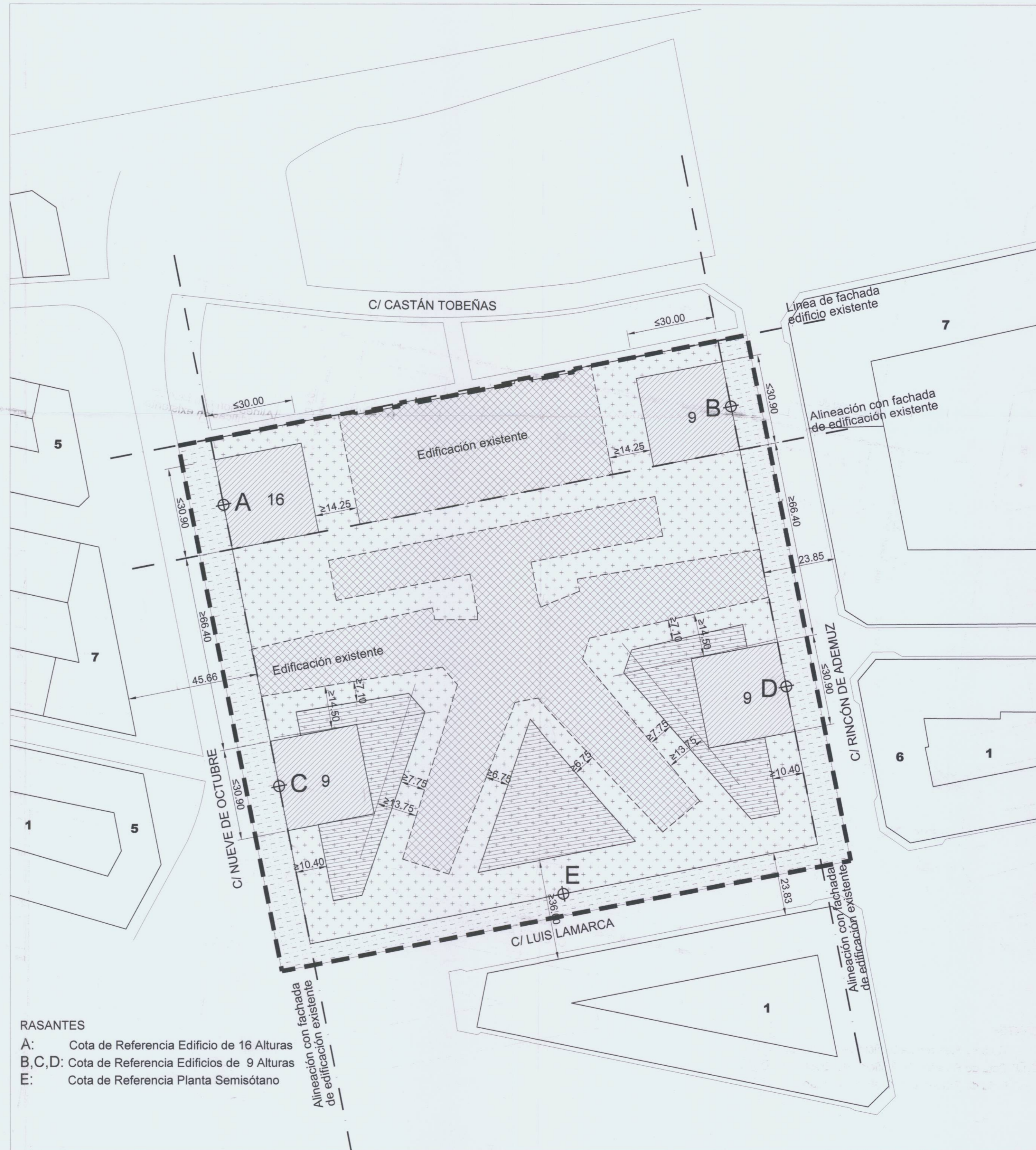
PLANTAS SOBRE RASANTE ALINEACIONES Y RASANTES

RASANTES A: Cota de Referencia Edificio de 16 Alturas B,C,D: Cota de Referencia Edificios de 9 Alturas E: Cota de Referencia Planta Semisótano