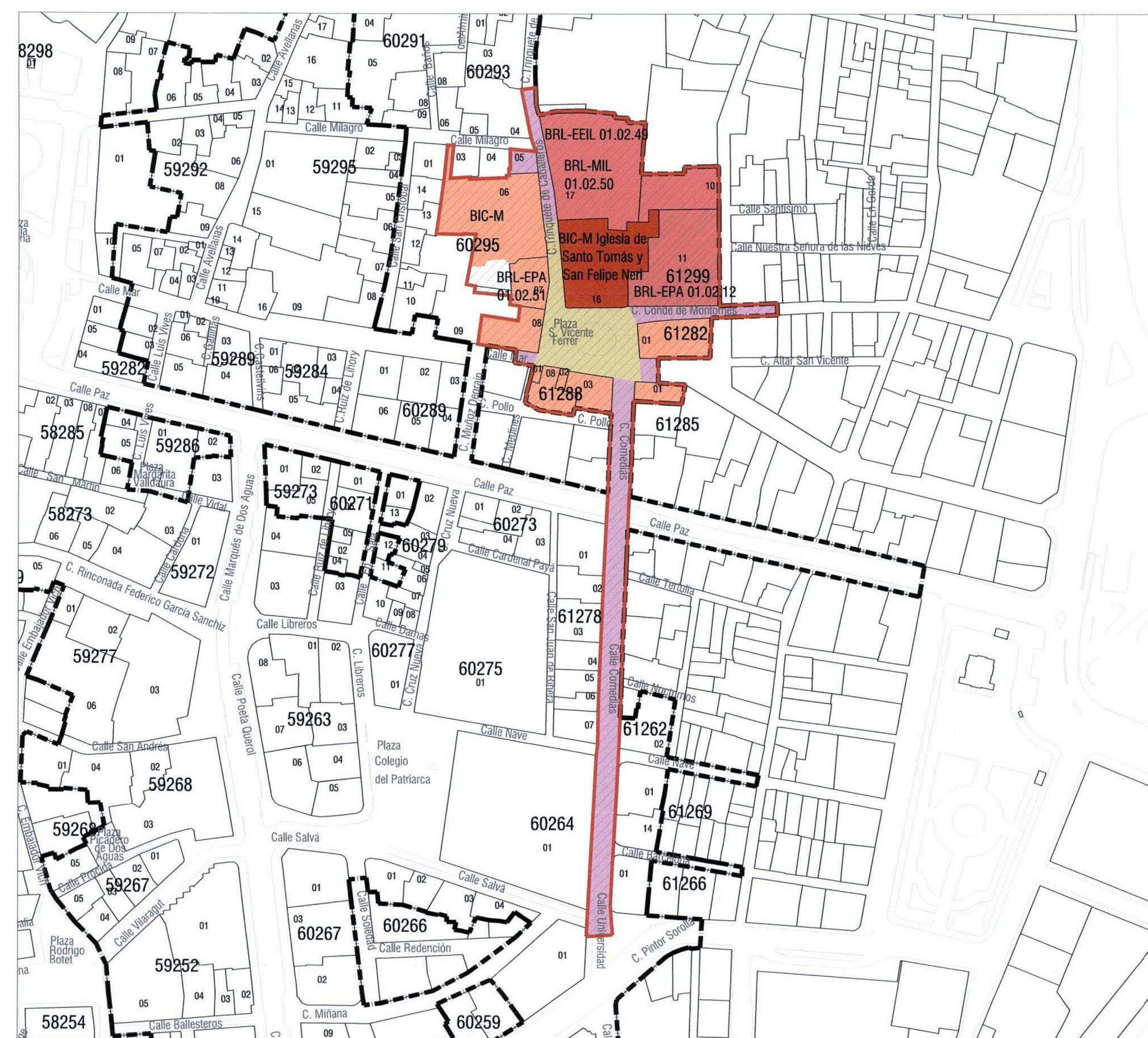
Entorno de protección de BIC-M Iglesia de Santo Tomás y San Felipe Neri

Bienes de Interés Cultural declarados incluidos en el entorno de protección: BIC-M Real Colegio Seminario del Corpus Christi o del Patriarca, BIC-M Muralla Islámica Bienes de Relevancia Local incluidos en el entorno de protección: BRL-EEIL. Retablo cerámico de San Juan de Ribera