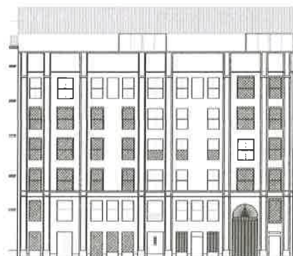
PLAZA DEL MIRACLE DEL MOCADORET