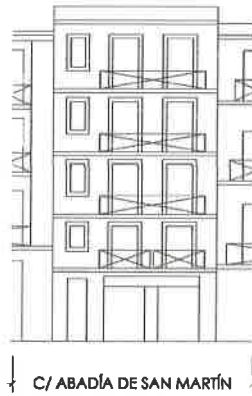
C/ ABADÍA DE SAN MARTÍN