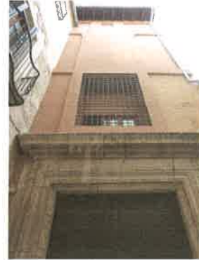
Detalle puerta de entrada y ventanales