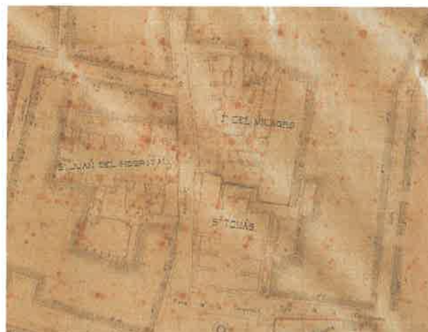
Plano geométrico de Valencia. 1892.