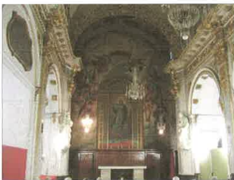
Presbiterio de la iglesia.