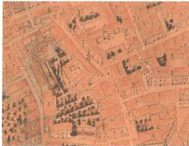
Valentia edetanorun aliis contestanorum vulgo del Cid. Dre Thomas Vincentio Tosca (1704).