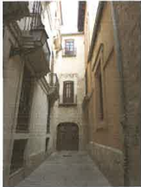
Vista del atzucat lateral