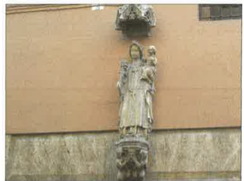
Vista de la talla de piedra de la Virgen con el Niño