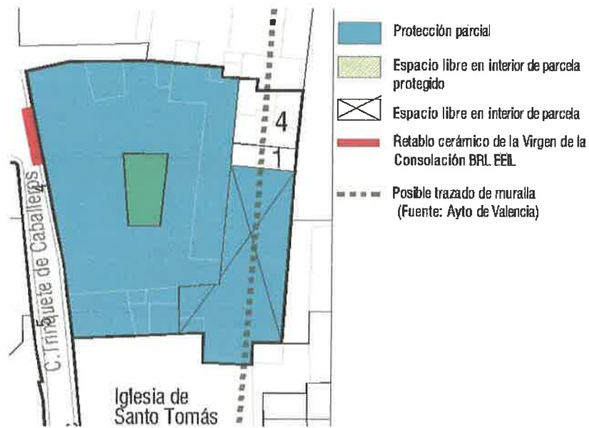
Plano de protecciones