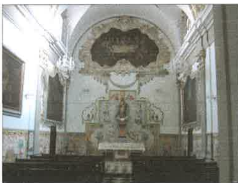
Capilla de la comunión.