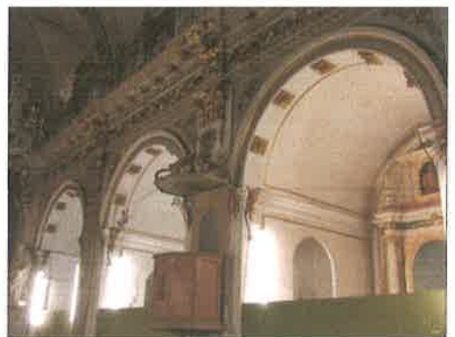
Capillas laterales de la iglesia.