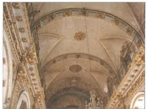
Bóveda de cañón con lunetas en la iglesia