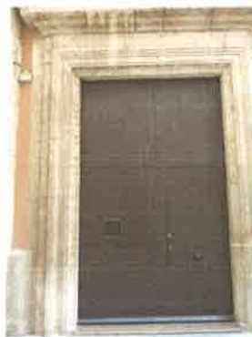
Detalle puerta de entrada