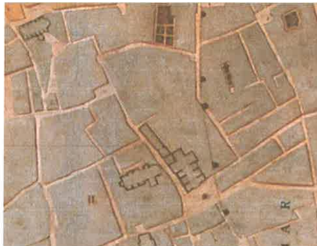
Plano geométrico y topográfico de la ciudad de Valencia del Cid, Coronel D. Vicente Montero de Espinosa. 1853