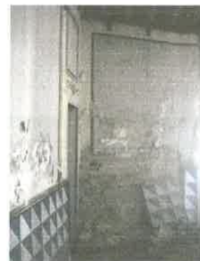
Vista interior de la capilla.