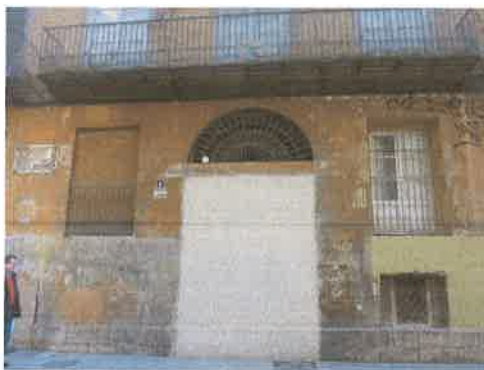
Vista de la parte posterior del edificio (planta baja) desde la Pza. San Esteban