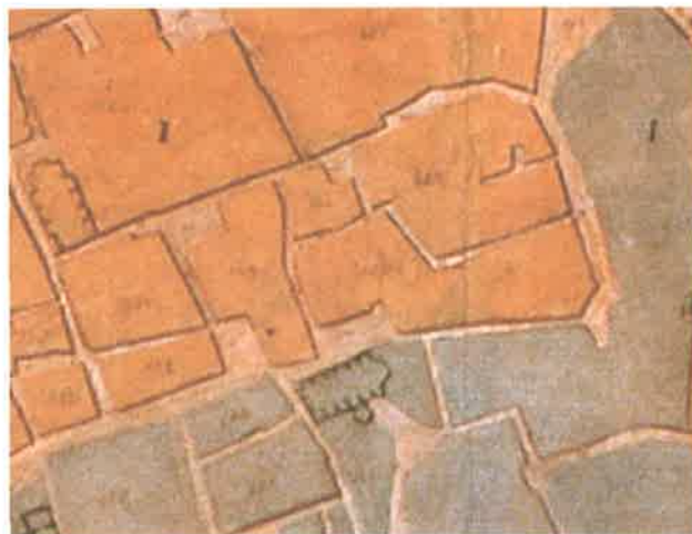
Plano geométrico y topográfico de la ciudad de Valencia del Cid, Coronel D. Vicente Montero de Espinosa. 1853