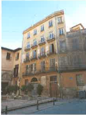
Vista del edificio en su conjunto. La capilla esta situada en la planta baja.