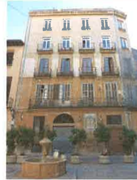
Vista del edificio en su conjunto. La capilla esta situada en la planta baja.