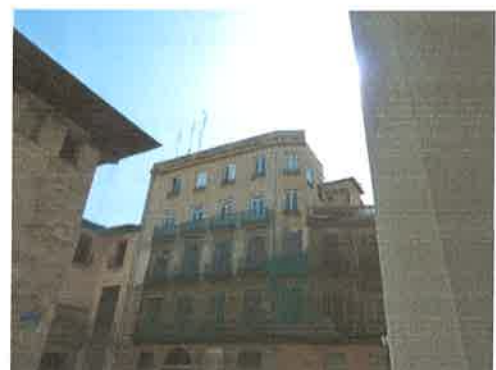
Vista de sobre-elevación impropia