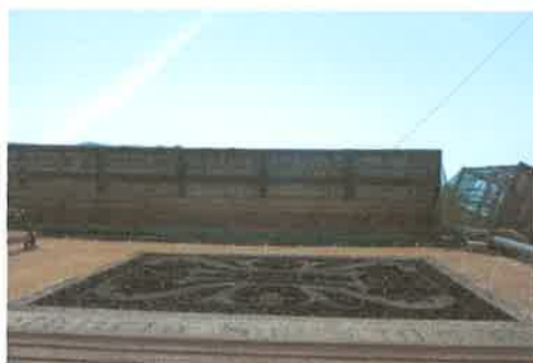
Vista de la cerámica de los sotabalcones