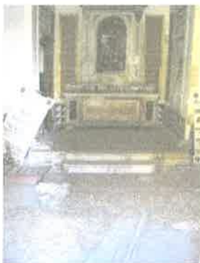
Vista interior de la capilla.