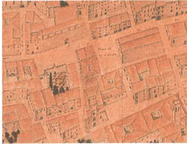
Valentia edetanorun aliis contestanorum vulgo del Cid. Dre Thomas Vincentio Tosca (1704).