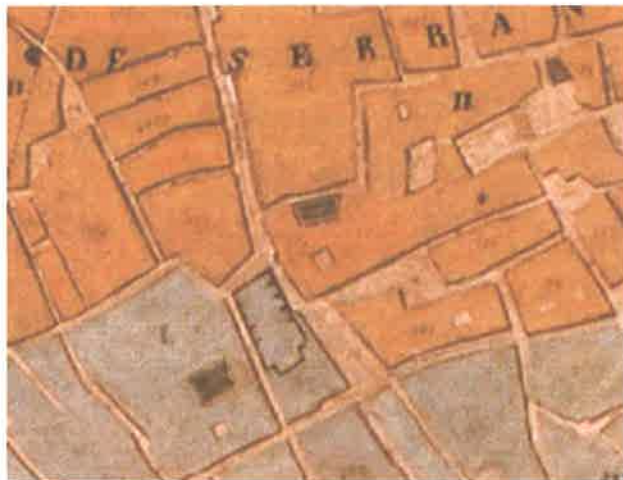
Plano geométrico y topográfico de la ciudad de Valencia del Cid, Coronel D. Vicente Montero de Espinosa. 1853