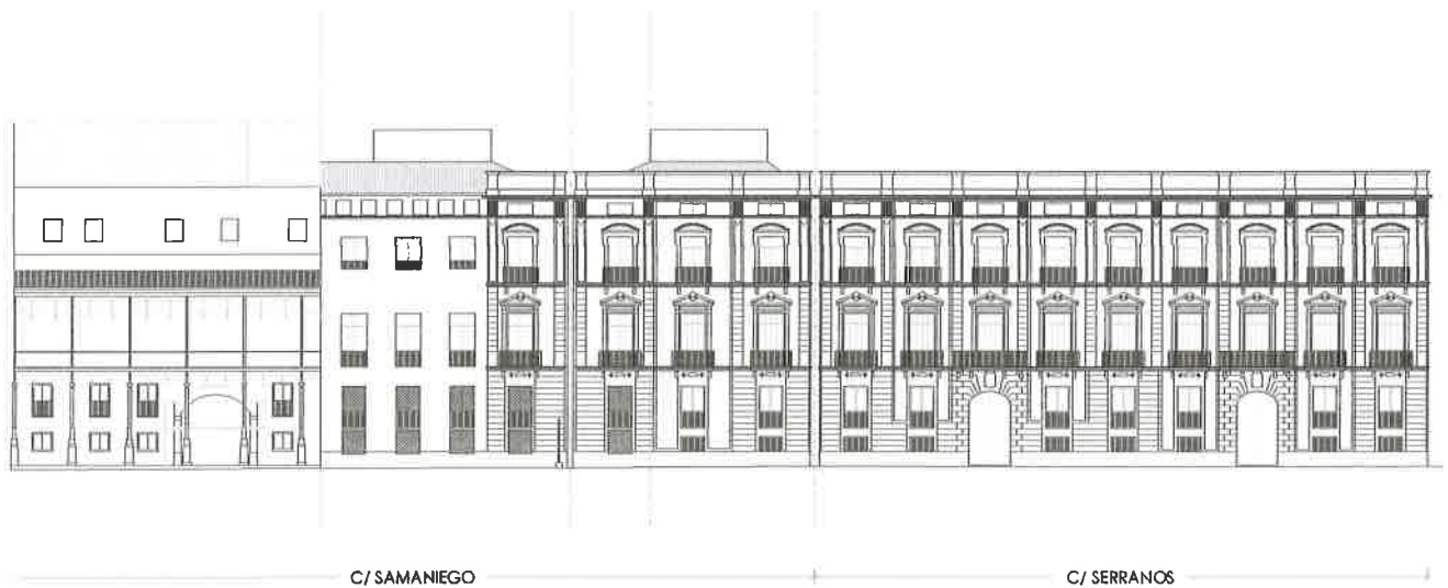
Alzados a Calle Serranos y Samaniego. E: 1/500