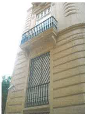
Detalle ventana y balcón