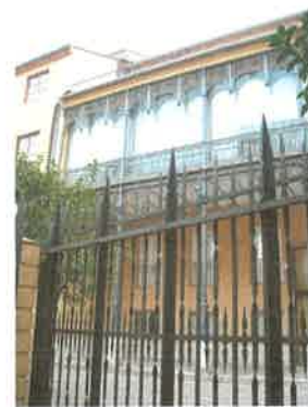
Patio de entrada desde C/ Samaniego