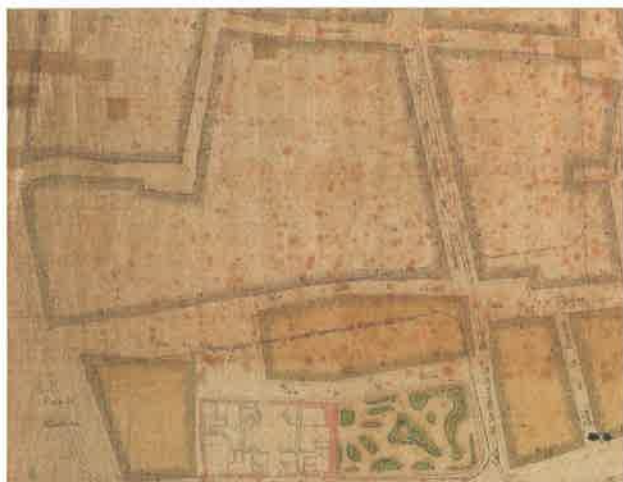
Plano geométrico de Valencia. 1892.