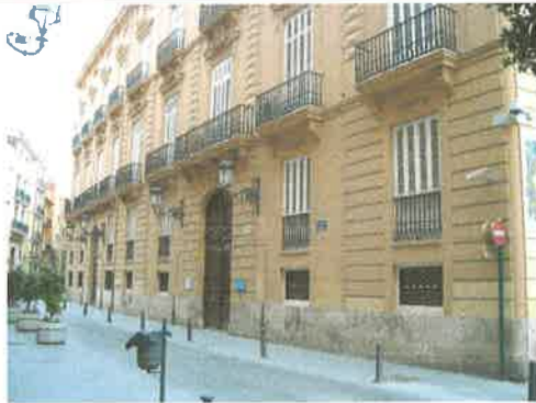
Fachada a Pza. de Manises