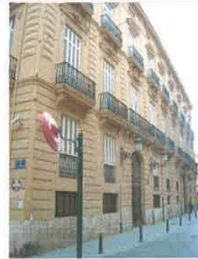
Fachada a Pza. de Manises