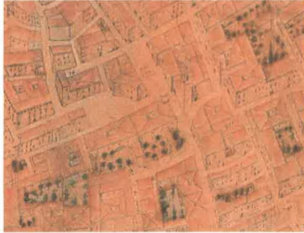
Valentia edetanorum aliis contestanorum vulgo del Cid. Dre Thomas Vincentio Tosca (1704).