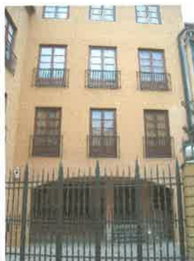
Patio de entrada desde C/ Samaniego