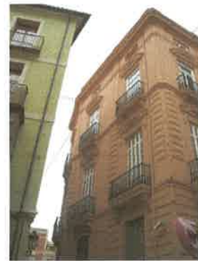
Vista fachada aC/ Serranos