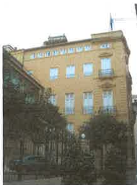
Vista desde C/ Samaniego