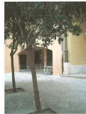
Patio de entrada desde C/ Samaniego