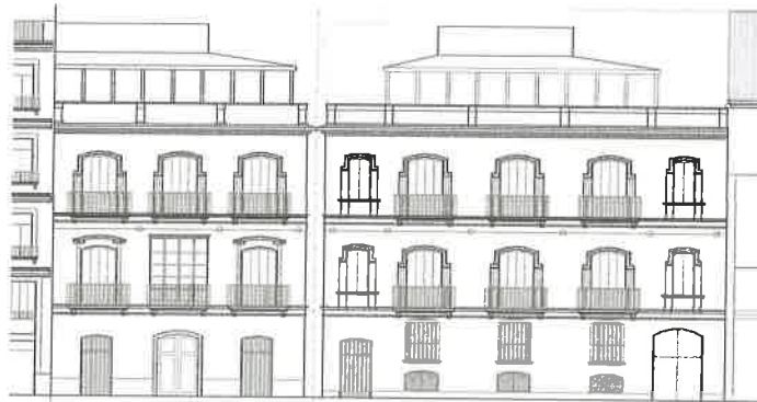
PLAZA BORNOS NICOLÁS PLAZA SAN NICOLÁS