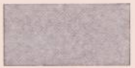
SUPERFICIE EDIFICABLE PROPUESTA EN EL E.DE DETALLE