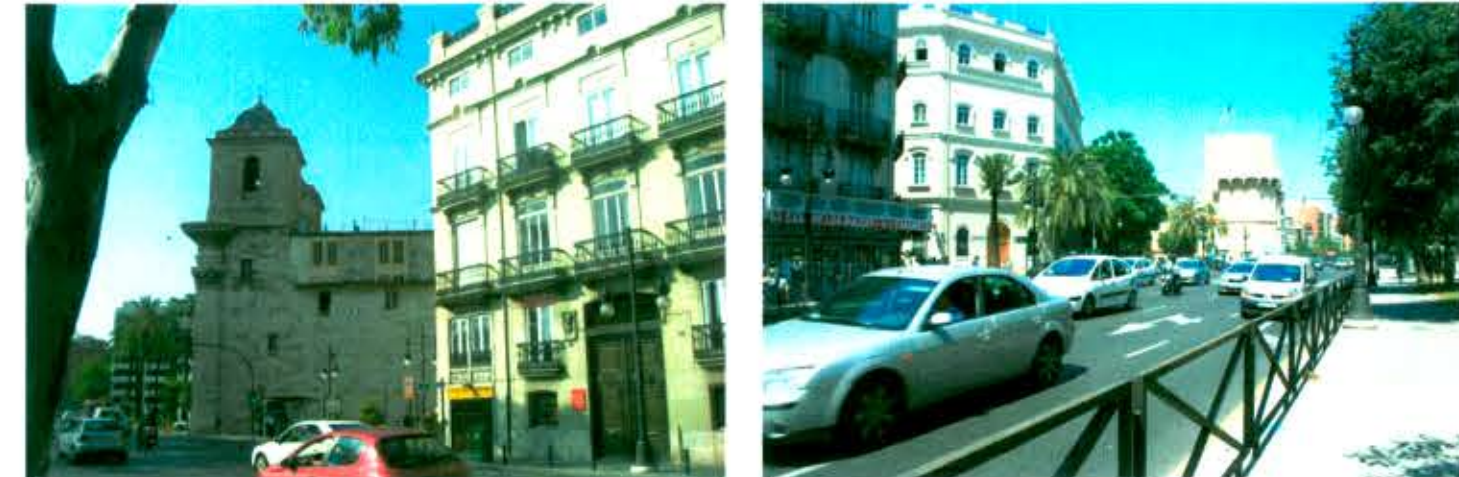
VISTAS DESDE PASEO DE LA CIUDADELA