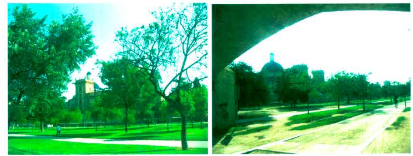
VISTAS DESDE EL ANTIGUO CAUCE DEL RÍO TURIA