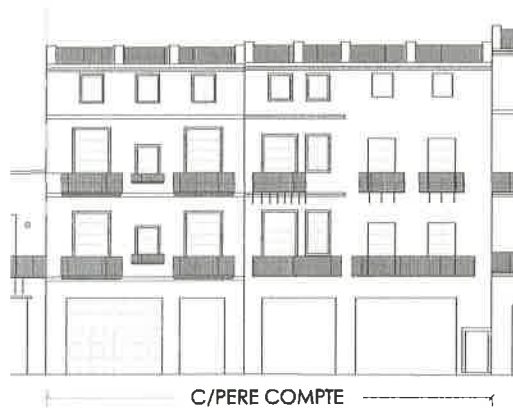
Alzado actual.