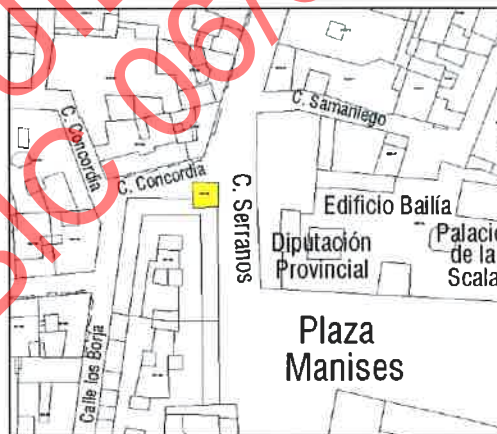
Parcelario Municipal 2008