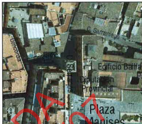
Fotografía Aérea 2008