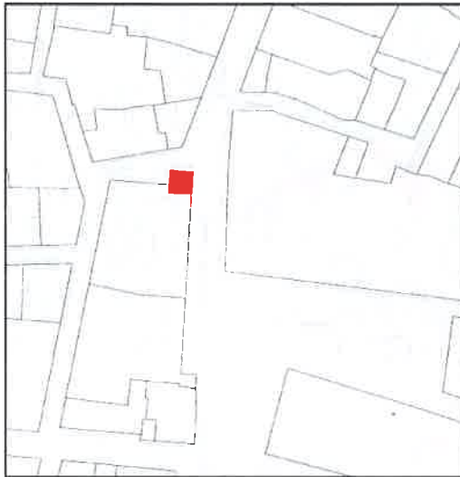
Entorno de protección. Identificación de los elementos protegidos