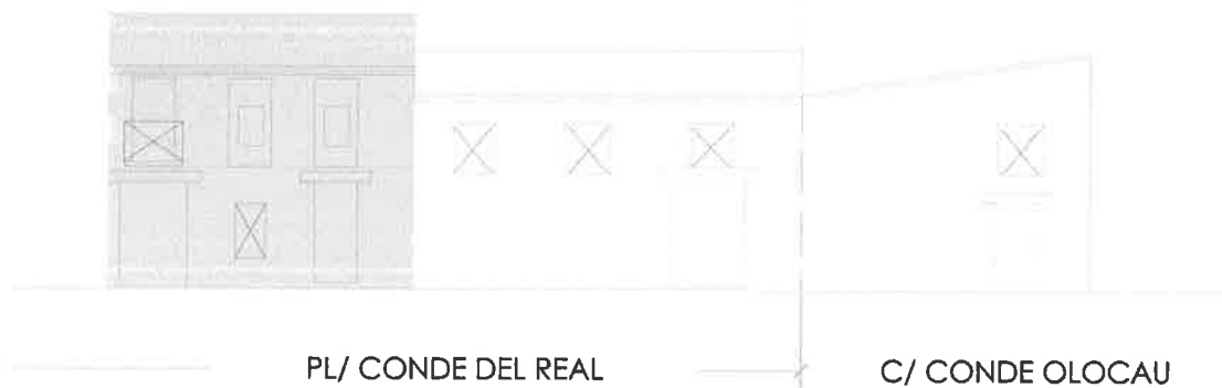
Estado actual de la edificación